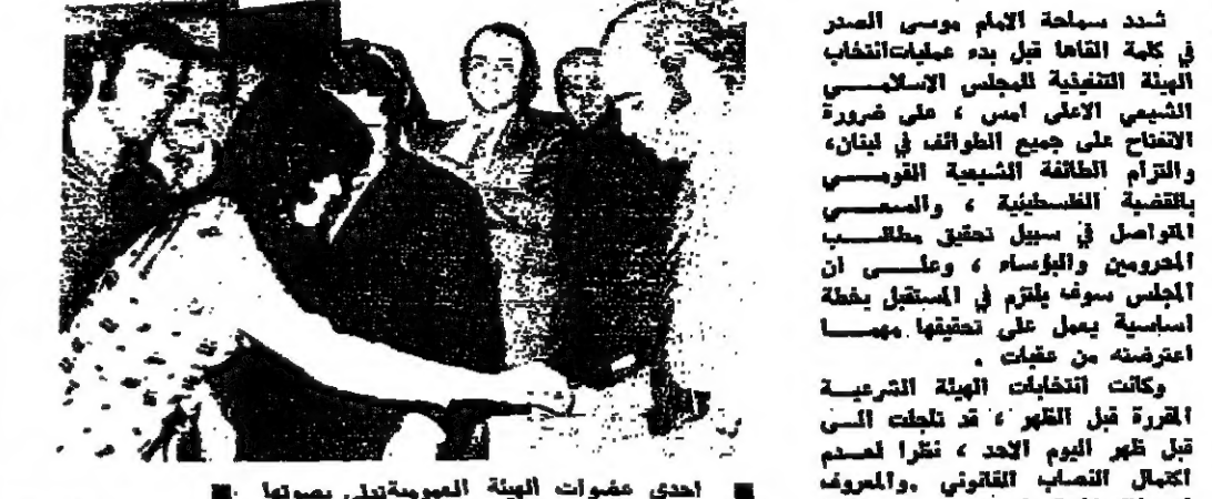
أحد عضوات الهيئة العمومية تدلي بصوتها في الانتخابات

شدد مسلمة الامام موسى الصدر في كلمة القاها قبل بدء عمليات انتخاب الهيئة التنفيذية للمجلس الاسلامي الشيعي الاعلى أمس، على ضرورة الانتباه على جميع الطوائف في لبنان، والتزام الطائفة الشيعية القومية بالثقافة اللبنانية، والمسعى المتواصل في سبيل تحقيق مطالب الحرومين والوفاء، وعلى ان المجلس سوف يلتزم في المستقبل بصفة اساسية بعمل على تحقيقها، مما اعترضه من عقبات. وكانت انتخابات الهيئة التشريعية المقررة قبل الظهر، قد تجلت في تلبية طموح الامم الحرة، نظرا لعدم اكتمال النصاب القانوني والمعروف ان هناك لجنة واحدة ينتظر ان تتوزع اليوم بالترتبة، بعد استكمال بقية المرشحين.